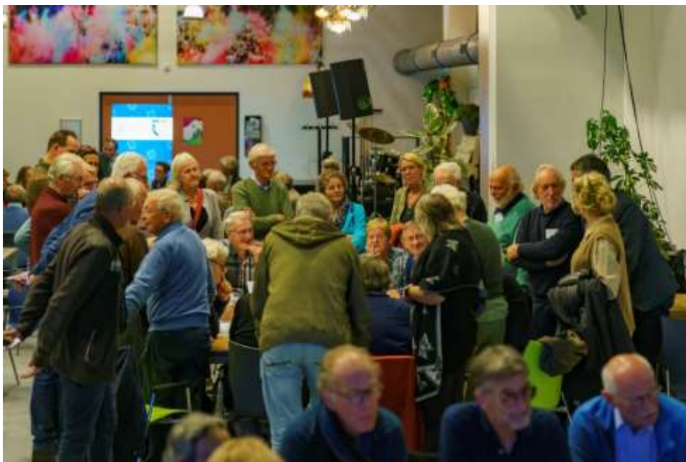
"gezellig druk en betrokken"