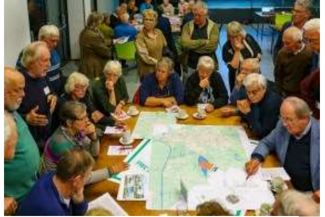
Een drukke tafel: de Vughtse Coöperatie Habitat

Bezoekers inclusief aanwezige politici zijn erg geïnteresseerd in de getoonde bouwkavels. Bij herhaling wordt gevraagd wanneer er gebouwd kan worden. Teleurstelling wordt uitgesproken over het feit dat van de 15 gemeentelijke locaties er maar 5 bij de gemeente bekend zijn. Er is behoefte aan meer duidelijkheid over bouwlocaties en de combinatie ervan met voorzieningen.