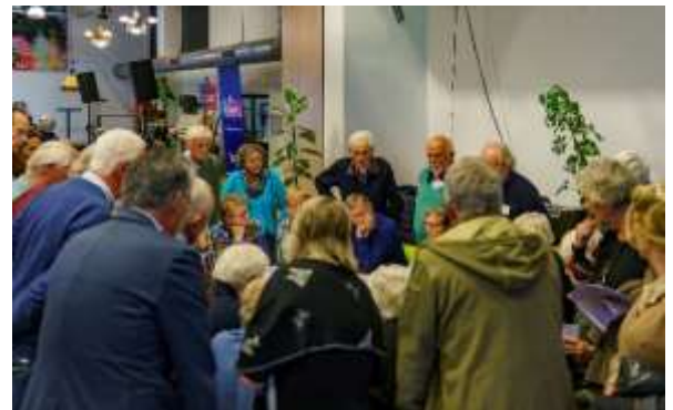
6 drukbezochte gesprekstafels

Tijdens de informatieavond maken de aanwezigen gretig gebruik van de mogelijkheid om in gesprek te gaan met deskundigen van de gemeente Vught, Woonstichting Charlotte van Beuningen, Vughterstede, Ouderen Samen, Duo Wonen en de Vughtse Wooncoöperatie Habitat. In de gesprekken gaan veel vragen en opmerkingen van ouderen over zaken als verhuizen, doorstroming, huren en/of eigen woning, nieuwbouw, zelf bouwen, woningsplitsing, beschikbare bouwgrond, rol gemeente bij projectontwikkeling, enz.