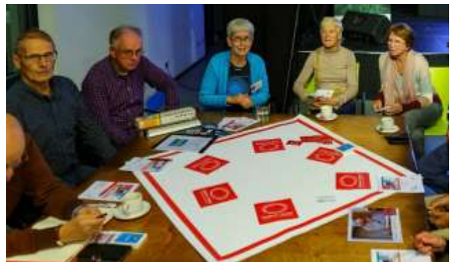
Drukbezochte tafel Ouderen Samen