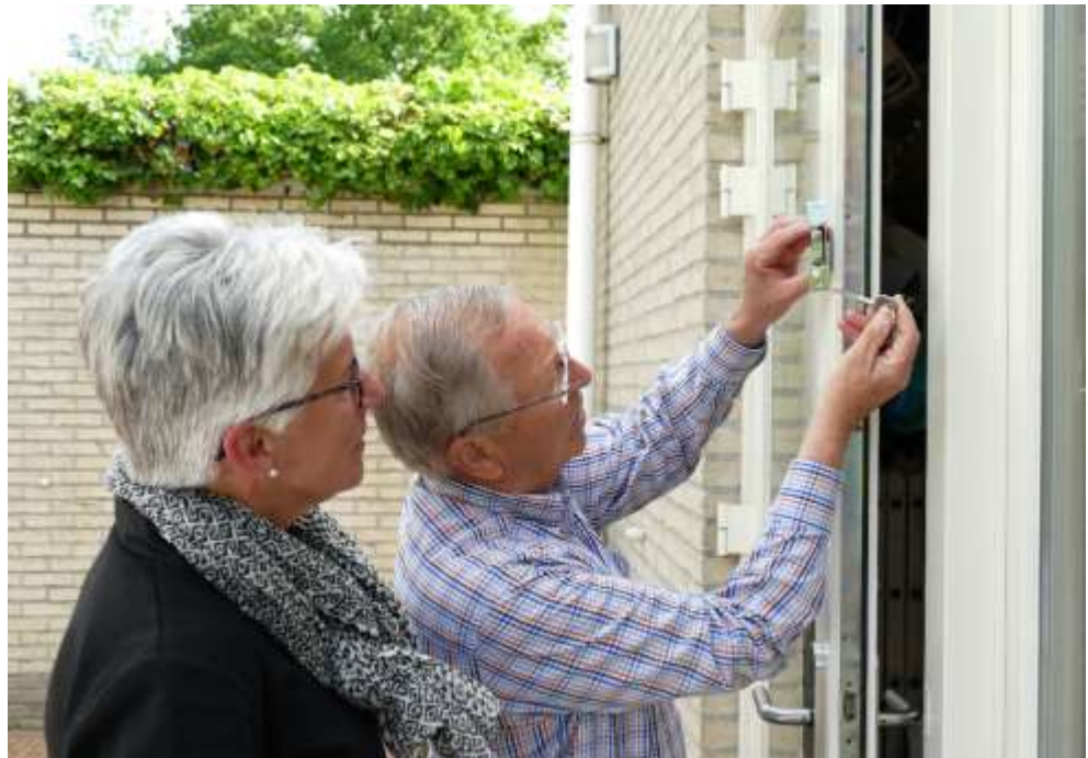
Woonadvies op maat

In samenwerking met de gemeente Vught zijn in 2 wijken brieven verstuurd naar ouderen om deel te nemen aan een voorlichtingsbijeenkomst. Tevens zijn er posters opgehangen en een uitnodiging in Het Klaverblad gepubliceerd hiervoor. Deze bijeenkomsten zijn gehouden in "De Petrus" voor de wijk Vught-Centrum en Taalstraat, en de wijk Schoonveld. Daarnaast is ons demonstratiemateriaal 3 maal getoond bij manifestaties voor ouderen in Vught en éénmaal in Rosmalen.