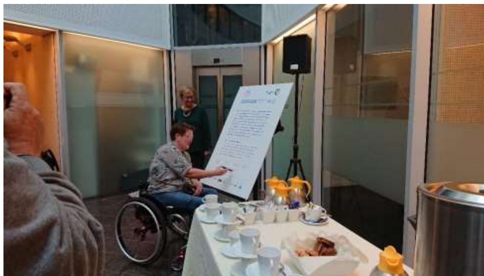
Ondertekening manifest "iedereen doet mee"

We hebben aandacht besteed aan fysieke toegankelijkheid en de beleidsmatige verankering van Toegankelijkheid op allerlei vlakken. Op 11 oktober 2019 heeft Vught het manifest "Iedereen doet mee" getekend. De gemeente heeft daarmee een inspanningsbelofte gedaan en wij als ervaringsdeskundigen worden meer betrokken bij het ontwikkelen van beleid "Over ons en met ons".