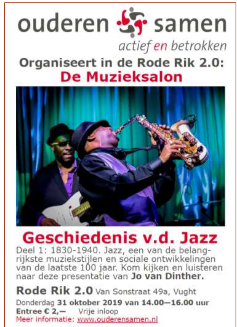
Poster voor de Muzieksalon