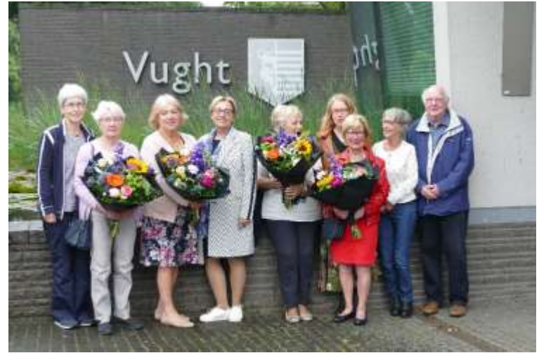
Eenjarig bestaan bezoekdienst

In juni werd het eenjarig bestaan gevierd met vrijwilligers en de wethouder. Naar aanleiding daarvan is een artikel gepubliceerd in het Klaverblad.