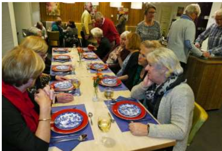
Draken of demonen, bijzondere Chinese gerechten