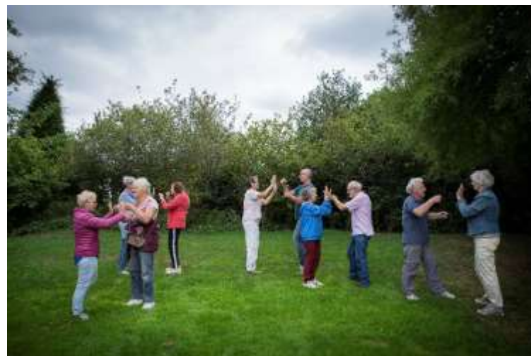
Lunchen en bewegen

De gelden van het Oranjefonds voor het programma Samen Ouder voor een periode van 3 jaar, zijn in het tweede jaar besteed aan een maandelijkse dansmiddag op de zondag en aan zinvolle dagbesteding. Er waren diverse beweegactiviteiten in de beweegweek. Een aantal deelnemers aan deze beweegactiviteiten heeft zich aangemeld voor "Meer bewegen voor ouderen", een activiteit die georganiseerd wordt door Ouderen Samen en 2 keer per week plaatsvindt.