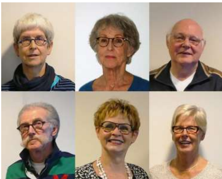
Het bestuur per 1 januari 2019